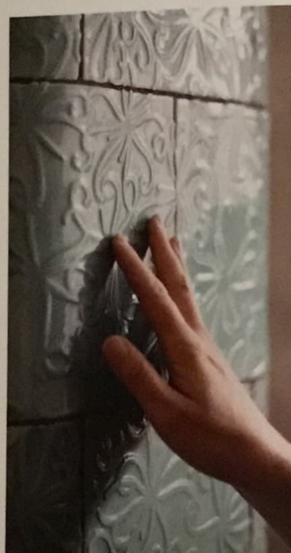
▲ Frökapslar gav Annika idén till mönstret.

TEXT JONATAN MÅLM