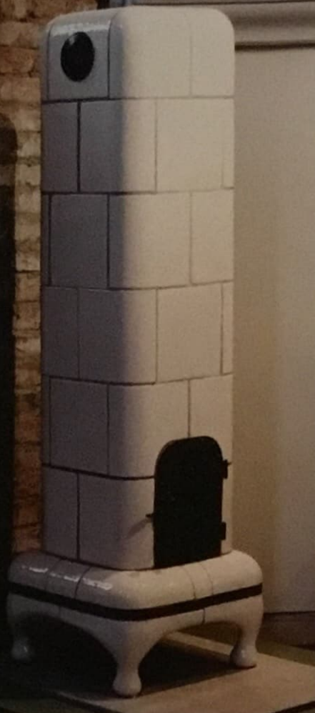
▲ Kakelugnsmodell i nätt format med två rökkanaler. De större har fem.